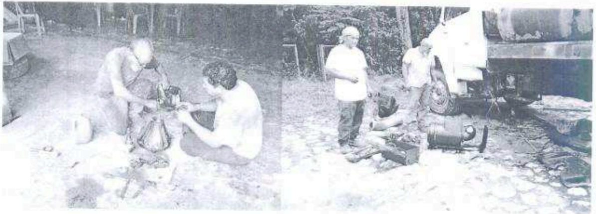
Reparación y cambio de engranaje de retrancas de las catarinas y filtros de aire del motor en los vehículos del Parque Nacional Tikal.