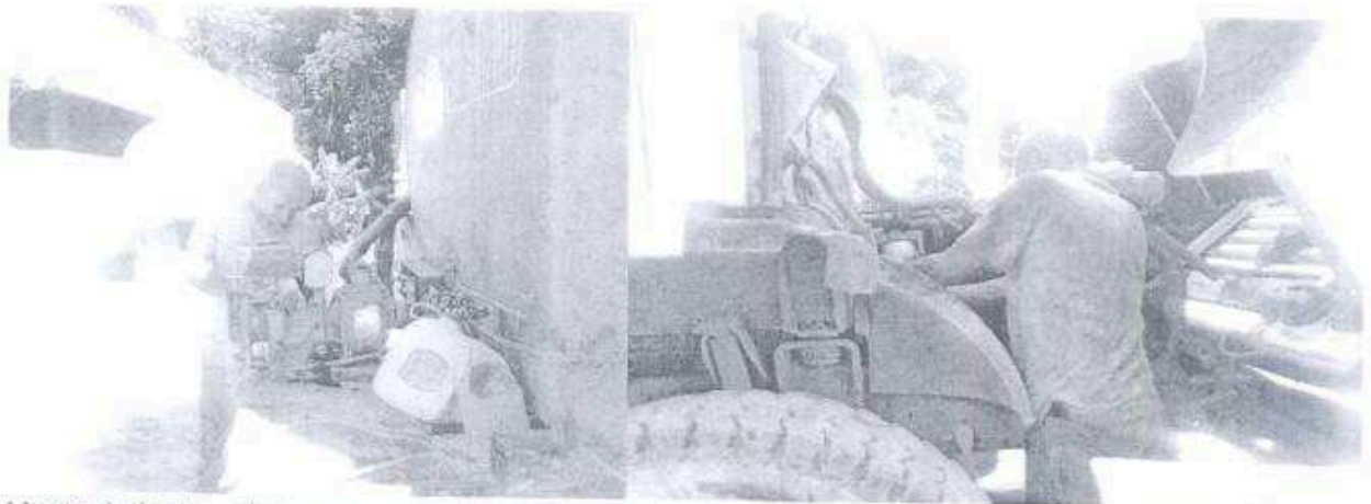
Mantenimiento, chequeos, reparaciones y cambios de repuestos y diferentes accesorios mecánicos al camión cisterna, que se utiliza para la disponibilidad del agua en el Parque Nacional Tikal.